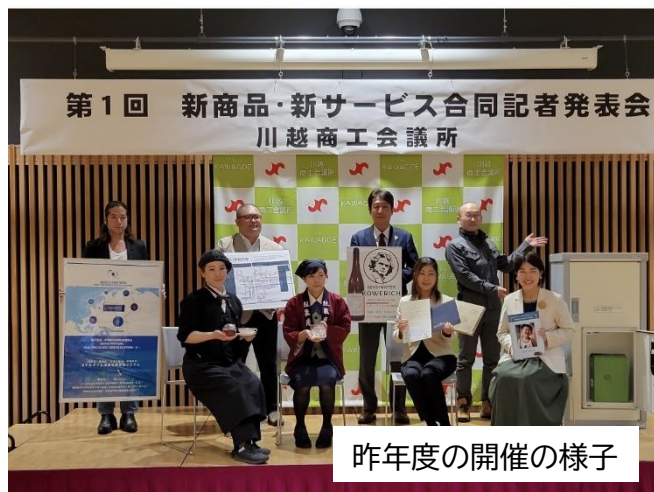
昨年度の開催の様子