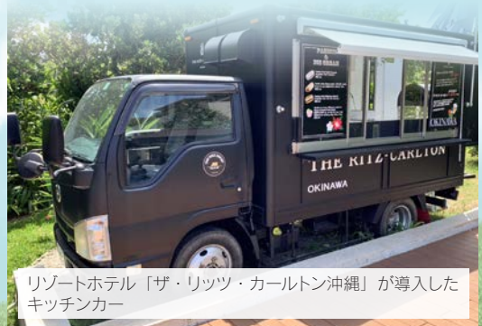
リゾートホテル「ザ・リッツ・カールトン沖縄」が導入したキッチンカー

長引くコロナ禍で、飲食店の経営は厳しい状況が続いている。そんな中で従来とは異なる営業形態の飲食店が注目されている。前号では飲食店の新形態「キッチンカー」を紹介した。今号では「バーチャルレストラン」と補助金情報を伝える。