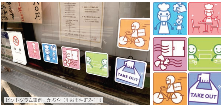
ピクトグラム事例 かぶや（川越市仲町2-11）

ほかにも、埼玉県は「彩の国「新しい生活様式」安心宣言」制度を設けています。安心宣言の書面を掲示したり、ホームページに掲載したりしている飲食店もあります。