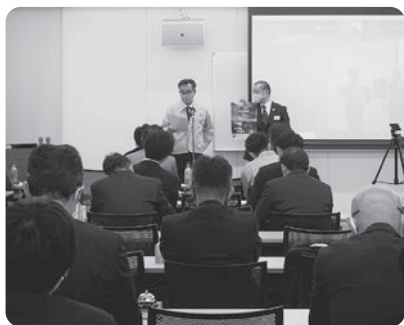
参加事業所による自社PR

オリエンテーションでは事業・サービスの紹介のほか、実際に当所のサービスを利用した会員事業所から商工会議所の活用事例として実体験のお話があり、同じ事業者同士ということもあり、共感しながら聞いていただけたのではないかと思います。その後、参加事業所による自社PRが行われ、今後、この事業がビジネスにつながるきっかけになることが期待されます。