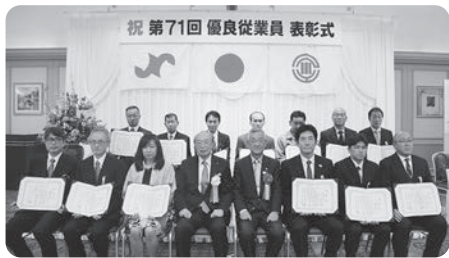
前回の表彰式の様子