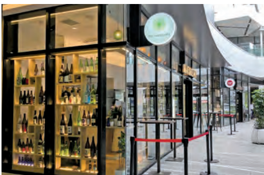
U PLACE 川越店 Standing bar MATSUZAKI

新店舗は蔵元のアンテナショップとしての役割も担う。もっと酒を飲みたい人には周辺の居酒屋を紹介する案内所の役割も果たしていく。松崎社長は「千里の道も一歩から。一つひとつ、夢みたいなきことを実現してきました。50年先のマツザキのため、持続可能な経営をしていきたいですね」と話していた。