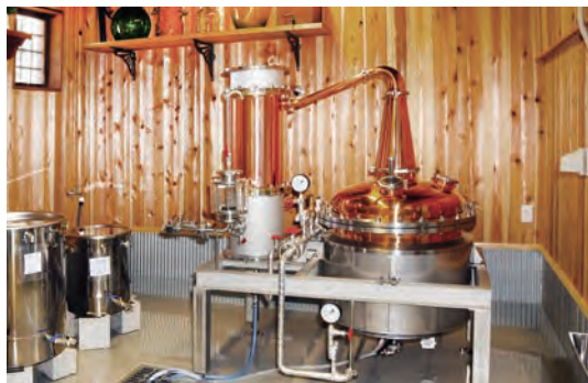
武蔵野蒸留所にはこだわり抜いた蒸留器が収まる

響で消毒用アルコールが品薄になって受けることを受け、ジンの製造をいったん停止し、消毒用アルコールに代用できる高純度のスピリッツ「ALCOHOL 77」を製造した。4月末から2カ月間で約1万本製造し、川越市と当所に各100本を寄贈するとともに、川越市医師会に情報提供を行い、市内の医療機関や福祉施設などに優先して販売した。