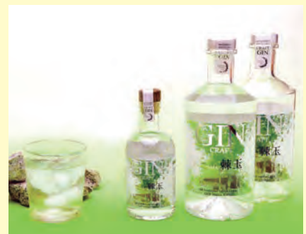
Japanese Craft Gin 棘玉(とげだま)

武蔵野蒸留所で製造したクラフトジン「棘玉(とげだま)」は、8月7日に発売予定だ。当初は6月の予定だったが、延期していた。新型コロナウイルスの影響