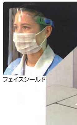
フェイスシールド

日高市で工業用プラスチックの切削加工を行っている会社です。このたび新型コロナウイルス飛沫感染防止用「フェイスシールド」、「アクリルパーテーション」を販売しました。「フェイスシールド」は、軽量で透明度が高く、繰り返し洗浄が可能です。「アクリルパーテーション」は、ご要望に合わせたサイズを製作します。詳しくはHPをご覧ください。