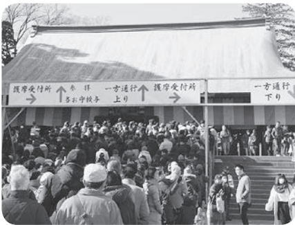
参拝客でにぎわう境内

1月3日、喜多院で川越初大師(だるま市)が開催され、約30万人の参拝者が訪れました。