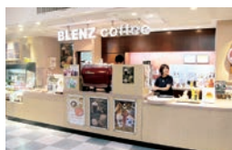
カナダ発祥のカフェ