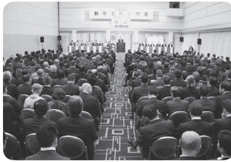
354名もの方々にご参会いただきました

新年の幕開けを飾る新年名刺交歓会が、1月11日、川越プリンスホテルにおいて開催されました。