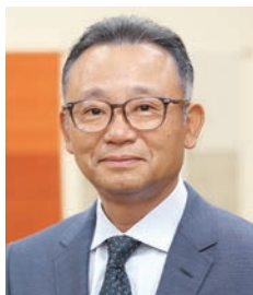
医療法人 真正会 社会福祉法人 真寿会 理事長