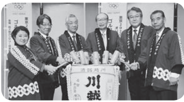
新年を祝して鏡開き