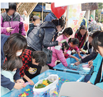
地域感謝祭の様子