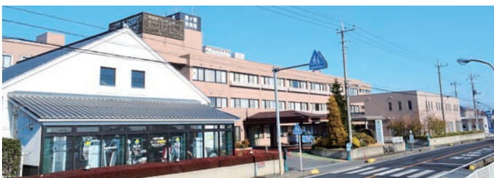
霞ヶ関南病院外観