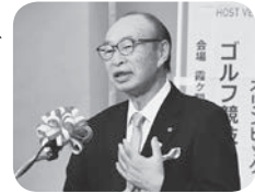
新年のあいさつを述べる立原会頭