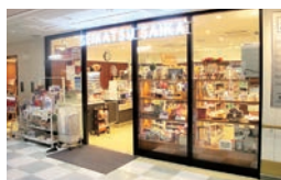
コンビニエンスストア