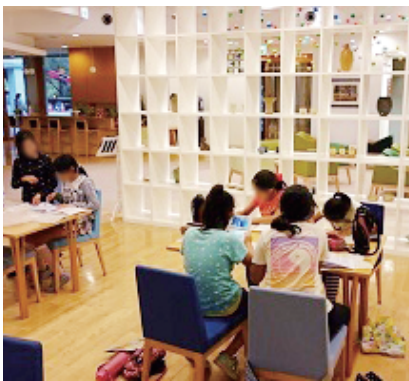
真寿園の地域交流スペースには子どもも集まる

「豊かな生活を送りながら安心して住み続けられる地域をつくるために、自治体が住民活動を支援し、人手や場所を持つ法人はプロデュースができる」といって考えています。地域に人が集まる場所づくりをしたいとも考えています。その目標は、共感してくれる職員がいてこそ実現できると思っています」。